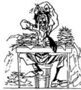
Der Herausgeber am 9 April